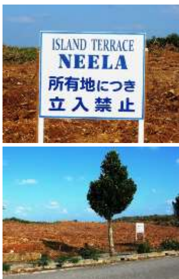
某ホテルによって不法に伐採された保安林。1年以上経過しますが、いまだに現状復帰の手続きがとられていません。

近年池間島では保安林を含む海岸林の不法伐採や海岸周辺の開発が加速し、島の景観が失われようとしています。先祖が残した大切な資源として、土地や集落景観、美しい自然などの原風景を守り、秩序ある方法により利用していくことが今後の島の発展には欠かせません。島民のみなさまのご理解・ご協力をよろしくお願いいたします。